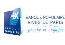
BANQUE POPULAIRE RIVES D...